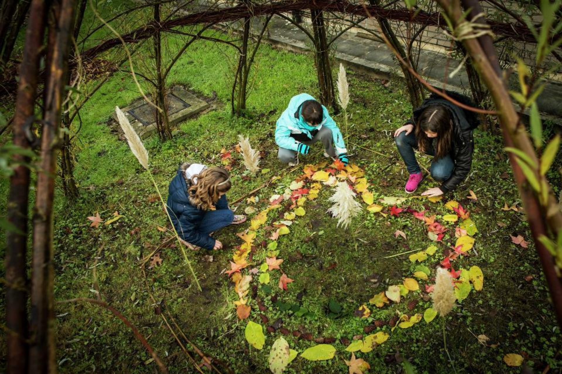
Basisschool Wonderwijs, Alken